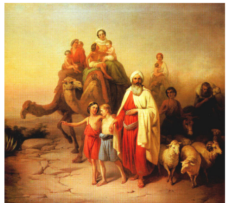
Abrahams Abreise aus Ur von Jozsef Molnar